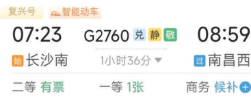
铁路12306标注的“敬”字车次。

据中国国家铁路集团有限公司(下称“国铁集团”)消息,为更好地服务广大老年旅客美好出行,铁路部门推出老年旅客淡季周中购票优惠。5月29日至6月30日(6月18日至22日端午假期运输期除外),年满60周岁及以上老年旅客,在非节假日周中(周一12:00至周五12:00)乘坐部分动车组(铁路12306标注“敬”字车次),实行票价“折上折”优惠,可在执行票价基础上再享受9折优惠。相关优惠车票于5月15日起陆续发售,长沙站始发的G2448次列车,长沙南站始发的G502次列车、G2760次列车、G1488次列车等都可以享受购票优惠。