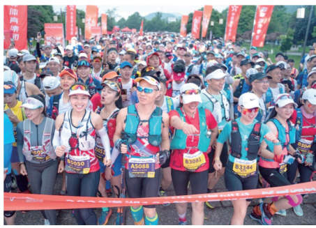
往届潇湘100系列越野赛。

“中国越野跑运动年轻化趋势明显,尤其是短距离项目,主打休闲交友。”薛乾曜介绍,人们有意愿在社交媒体上分享户外穿搭、参赛体验,寻求志同道合的好友。