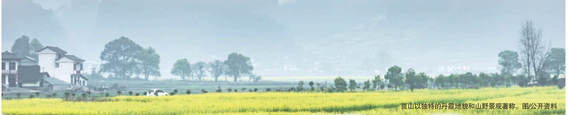
崑山以独特的丹霞地貌和山野景观著称。图/公开资料