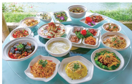
白沙古镇必吃榜——白沙豆腐。

白沙古镇位于浏阳市大围山镇,拥有800余年历史,古时商贾云集,被誉为“小南京”。大溪河从古镇穿插而过,水质清冽,映照着古桥和两岸的古建筑,形成一幅秀美的山水画。