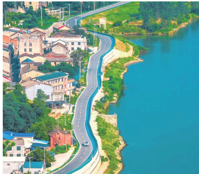
盛产花岗石(麻石)而闻名的丁字古镇。组图/长沙发布