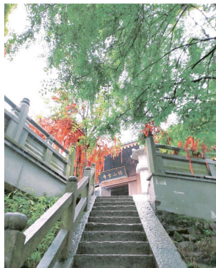
昭山古寺又叫昭阳寺,建于唐初年间。

昭山古寺位于山顶,四周环绕着青山绿水,仿佛在无声地诉说着古寺历史。昭山古寺又叫昭阳寺。建于唐初年