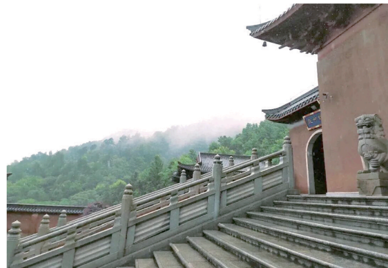
昭山的“山市晴岚”是“古潇湘八景”之一。